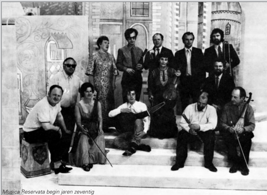
Musica Reservata begin jaren zeventig